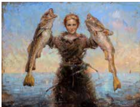
Verk av Jonny Andvik

NB! Utstillingen står også etter Kulturvøkku fram til 25. juli. I perioden 06. – 12.juli åpent kl 14.00 – 18.00 hver dag, i perioden 15.-25. juli åpent hver dag kl 14.00 – 18.00, med unntak av mandager og tirsdager da det er stengt.